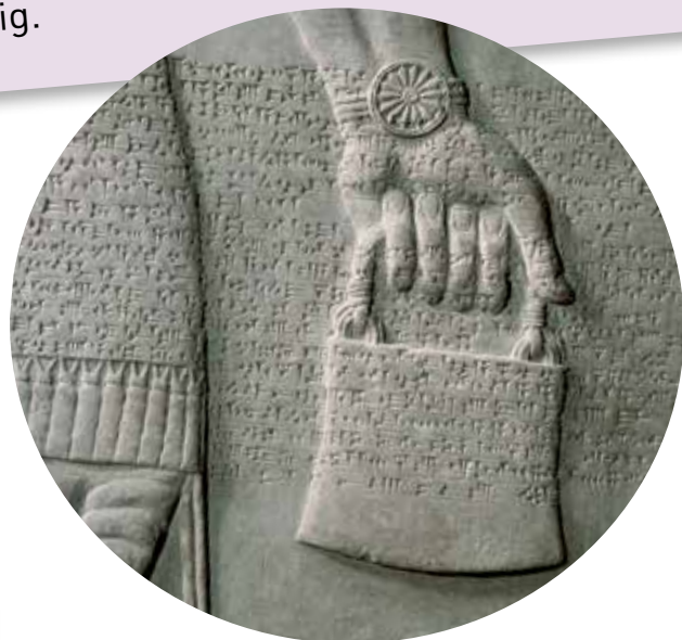
Detalj fra et relieff av en ånd med ørnehode, ca. 860 før Kristus.

Arbeid som om du skulle leve evig, elsk som om du skulle dø i dag.